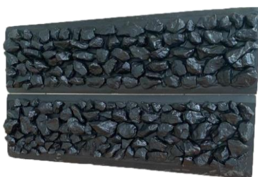
Рис. 2. Образец препятствия «Камни»

https://drive.google.com/file/d/12pkORT4WogY2BTweVbE-hFxz5EXTxLcJ/view?usp=drive_link